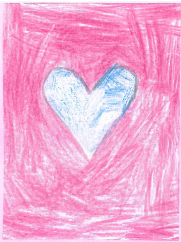
Le Diamant x20