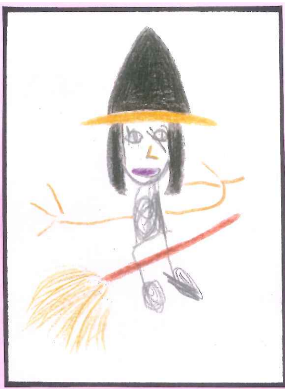
La Sorcière x5

Découper et reproduire les cartes ci-dessus en prenant compte du nombre indiqué dessous.